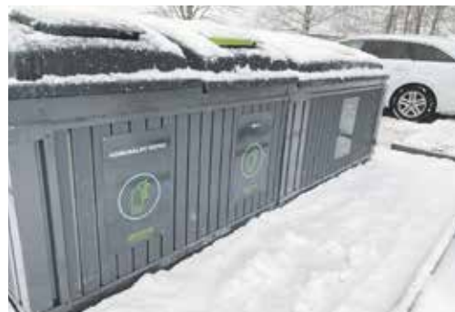
Polozapustené kontajnery prispievajú k čistote Košút.