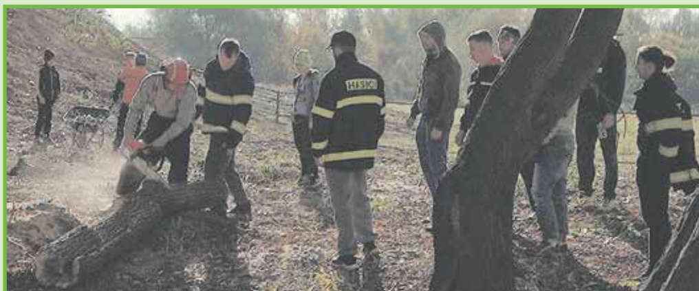
Do aktivít v Záturčí sa brigádami zapájajú aj občania, tradične pomáhajú aj dobrovoľní hasiči.

budú v Záturčí postupne dopĺňať hracie prvky na ihriskách pre deti a mobiliár oko-