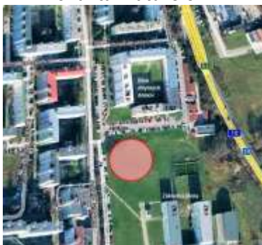
Priestor pre situovanie parkovacieho domu v sídlisku HBV Záturčie