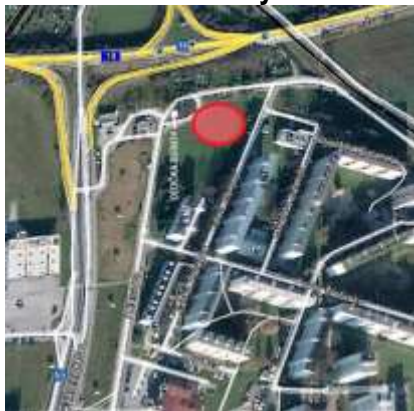
Priestor pre situovanie parkovacieho domu v sídlisku HBV Košúty II

Územie vybrané na riešenie a situovanie parkovacieho domu sa nachádza na nezastavanej ploche, na pozemku vo vlastníctve Mesta Martin, severne a severozápadne od obytných domov na Ul. Janka Alexyho a v smere na východ a juh od zbernej komunikácie – Ul. Dubravca, vedenej po obvode obytnej zóny. V smere na juh sa nachádza bytový bezbariérový dom so 4 nadzemnými podlažiami. V smere na